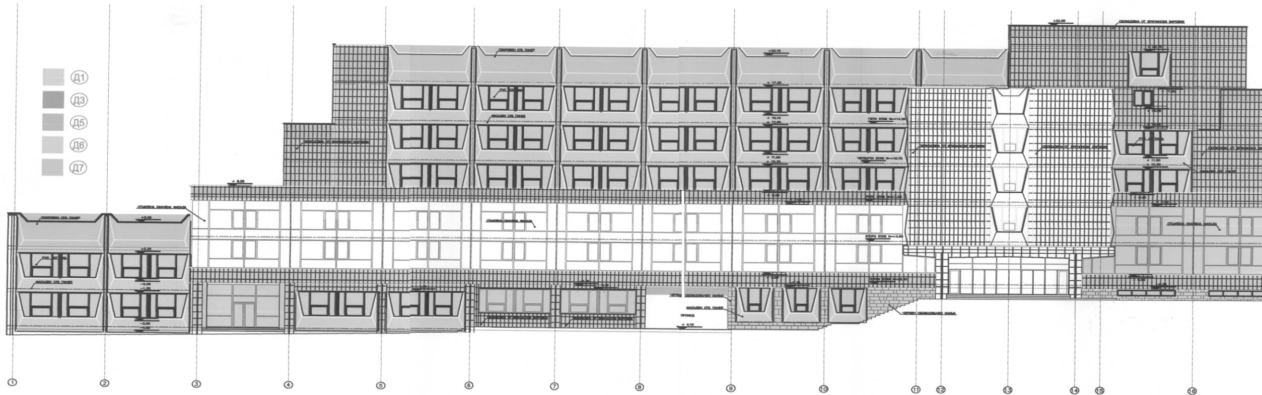
корпус А - фасада Север

ГДПБЗН СТОЛИЧНО УПРАВЛЕНИЕ "ПБЗН" СЪГЛАСУВАН